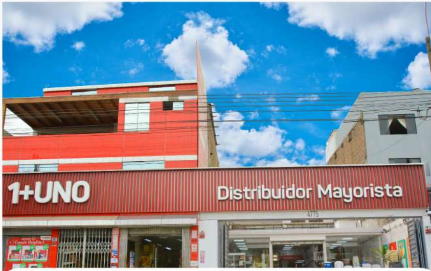
AV. AVIACIÓN 4755 – SANTIAGO DE SURCO