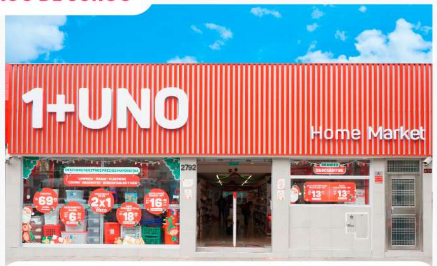
AV. AVIACIÓN 2792 – SAN BORJA