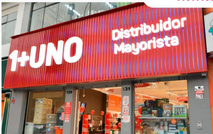
CALLE CHAMAYA 131 – SAN MIGUEL